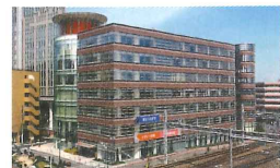
醫療保健學院專用大樓